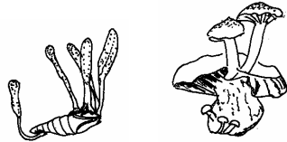
サナギタケ 冬虫夏草の仲間 虫の体やサナギから生えるキノコ

5. 石から生えるキノコはありません。キノコは自然界の分解者といわれ、植物やいろいろな生き物、そのフンを、植物の栄養となるよう分解しています。